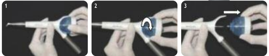
Den Pulverbehälter 90° gegen den Uhrzeigersinn drehen und aus dem Handstück nehmen. (Bild 1-3)

Als Erstes stellen Sie bitte die Wasserdurchflussmenge wie folgt ein: ca. 15 ml/Min. (in Tropfenform; am Turbinenschlauch bzw. an Ihrer Einheit einzustellen und zu regulieren). Der Luftdruck an Ihrer Einheit sollte zwischen 3-4 bar betragen.