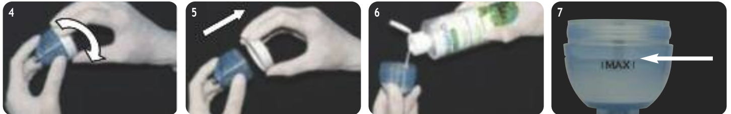
Deckel des Pulverbehälters gegen den Uhrzeigersinn aufdrehen, abnehmen und mit dem von SATELEC empfohlenen Pulver befüllen (Bild 4-6). Höchstfüllstand (Markierung „MAX“/Einkerbung) dabei keinesfalls überschreiten (Bild 7).