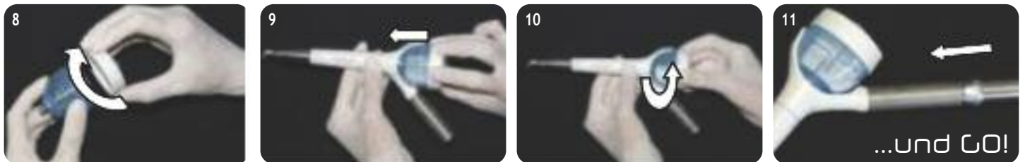
Pulverbehälter verschließen (Drehung im Uhrzeigersinn) und wieder in das Handstück setzen und einrasten (mit einer 90° Drehung im Uhrzeigersinn) (Bild 8-10). Das Handstück an den Turbinenschlauch anschließen (Bild 11). Sie können jetzt mit der Behandlung beginnen.